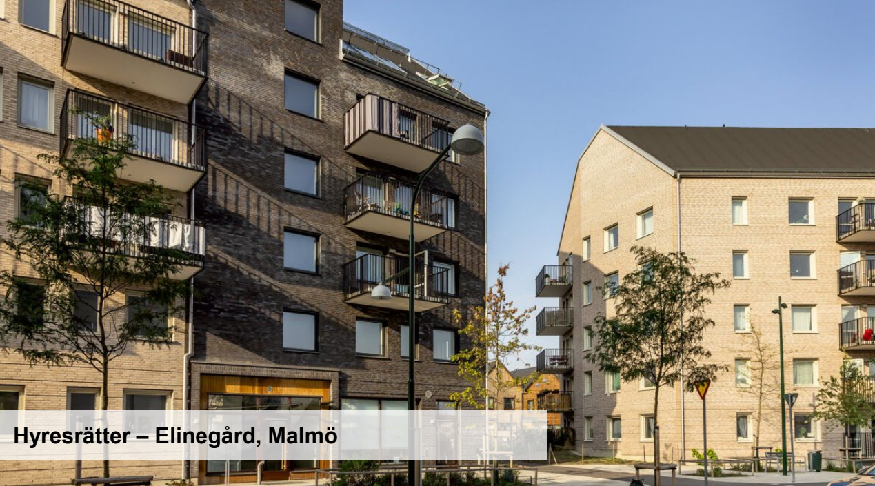
Hyresrätter – Elinegård, Malmö