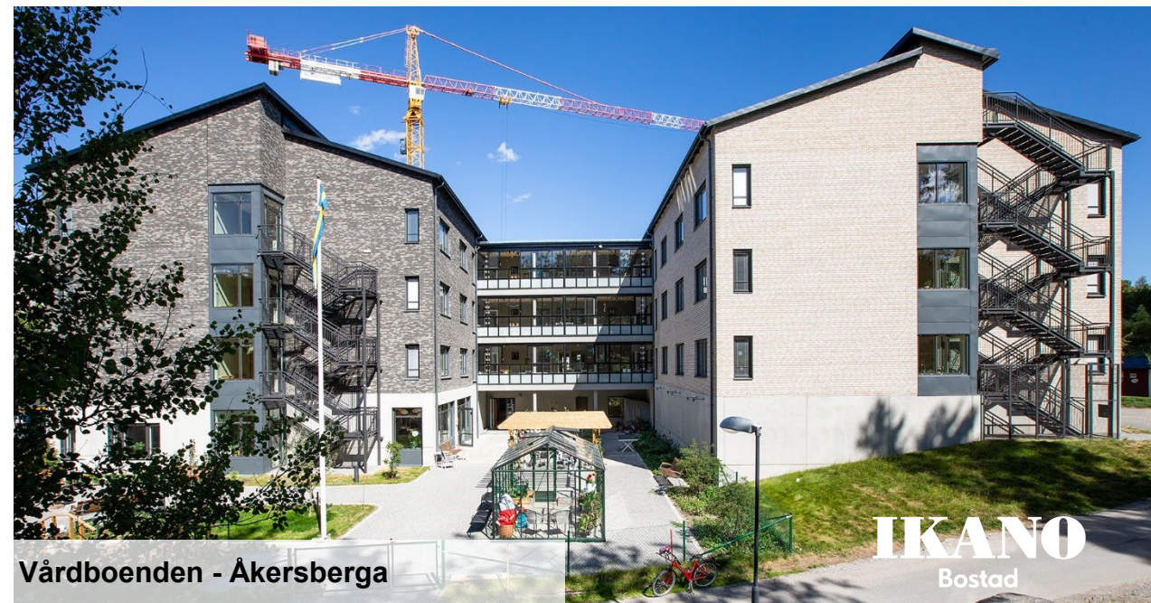
Vårdboenden - Åkersberga