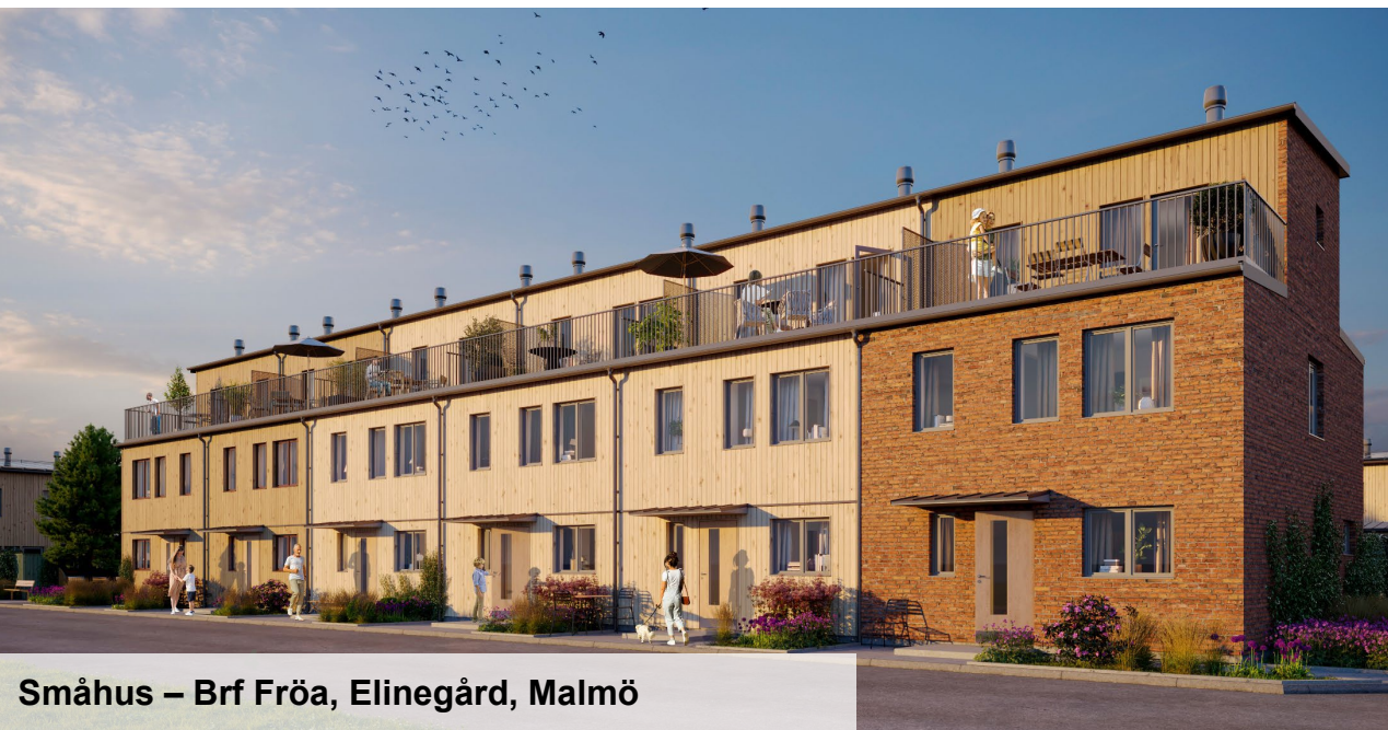
Småhus – Brf Fröa, Elinegård, Malmö