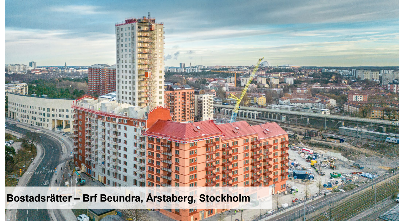
Bostadsrätter – Brf Beundra, Årstaberget, Stockholm